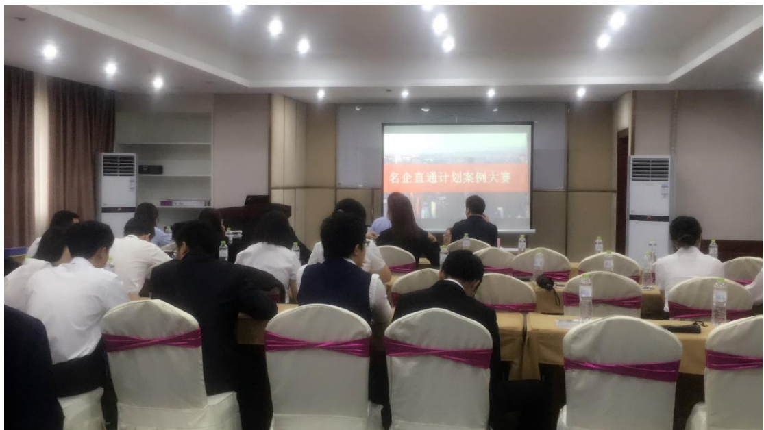
FRM 学员案例分析大赛现场照片