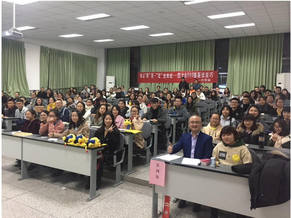
FRM 学员参加四大&500 强面试技巧学习照片