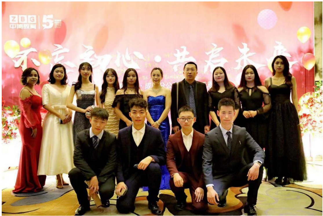
FRM 学员参加酒会照片