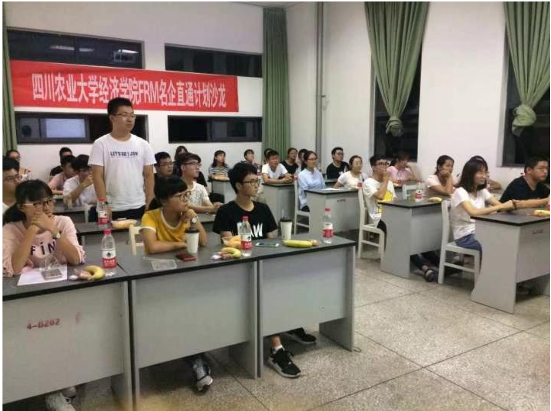
FRM 学员沙龙分享照片