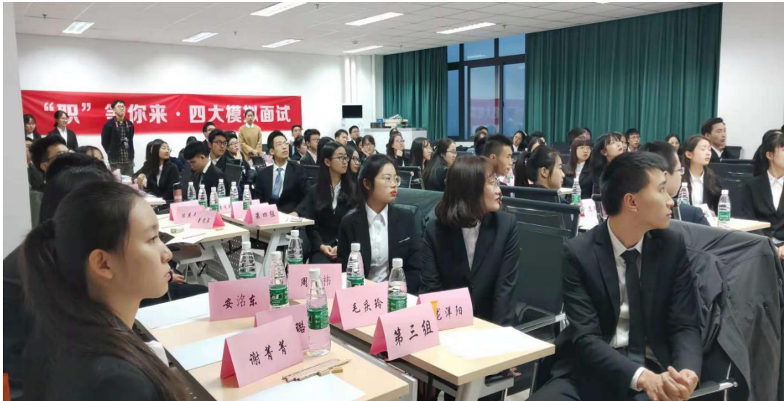
FRM 学员“四大模拟面试”现场照片